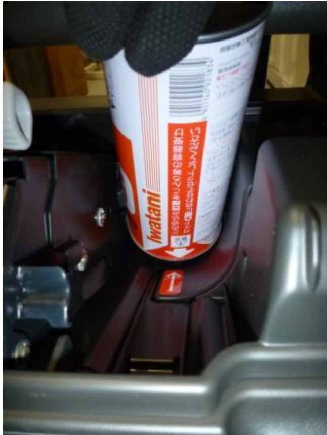
※本体とボンベの矢印を合わせてボンベを入れる