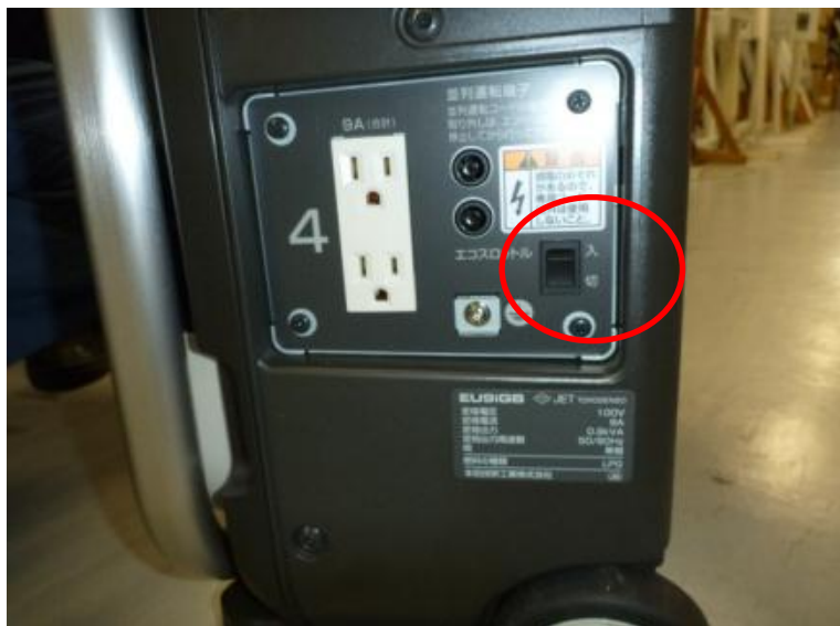
※状況に応じてエコモードで使用する