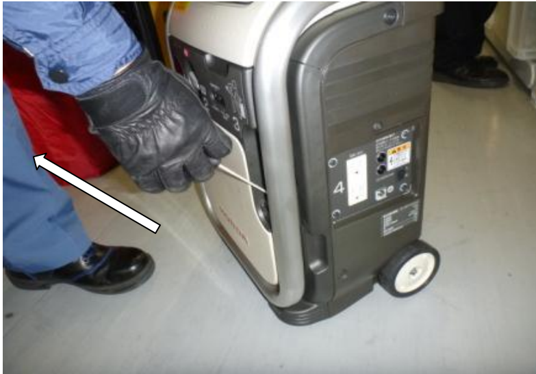
※ハンドルを引いてエンジンを始動させる